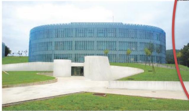
Sede de Solmicro en el Parque Tecnológico Bizkaia.

Sus principales objetivos para el año recién estrenado pasan por mantener la línea de crecimiento del volumen global de negocio de la compañía en al menos dos dígitos; reforzar y ampliar la facturación procedente de los mercados latinoamericanos; incrementar la plantilla en torno a un 10%; y, en la parte de I+D+i, seguir evolucionando tecnológicamente y funcionalmente la nueva versión de su ERP