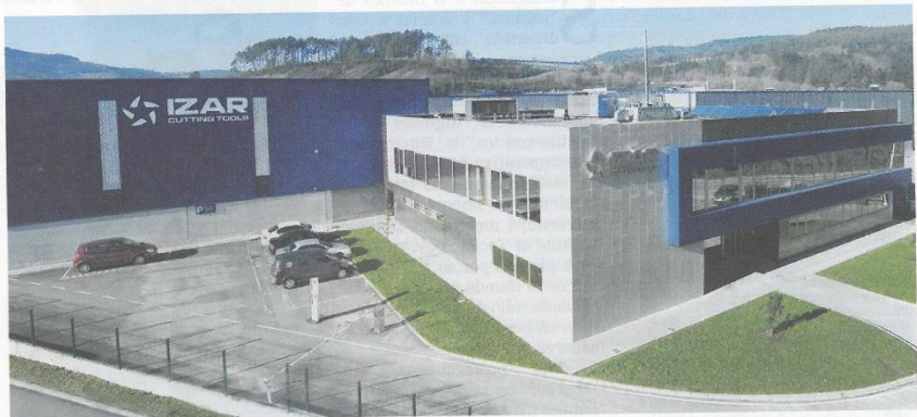
Vistas exterior de la planta que Izar Cutting Tools tiene en la localidad vizcaína de Amorebieta.

En este sentido, las mismas fuentes han señalado que la empresa ya ha contactado con varios proveedores europeos líderes en maquinaria CNC para que suministren equipos que permitan, de forma eficiente y precisa, el rectificación de los canales