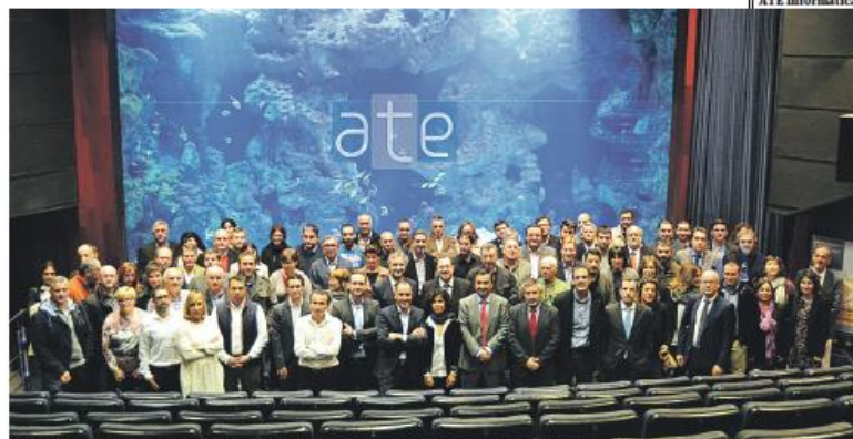
Foto final del acto de celebración del 10º aniversario de colaboración entre ATE y Solmicro.

Así, en el evento, celebrado el pasado 22 de octubre en el Aquarium donostiarra, ambas compañías compartieron con todos los grupos de interés (clientes, proveedores y entorno) los logros conseguidos al tiempo que se reafirmó la apuesta de ATE Informática por Solmicro y eXpertis. Además