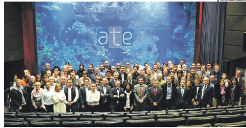
Foto final del evento conmemorativo del 10º aniversario de colaboración entre ATE y Solmicr.